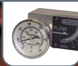
Flussometri Olio/Acqua Calda