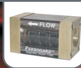
Porta di filtrazione magnetica Ferrogard™